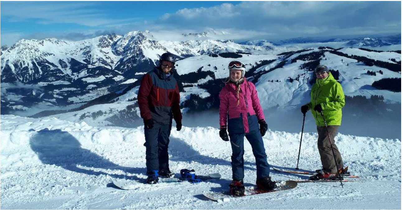
Im Hintergrund der Wilde Kaiser