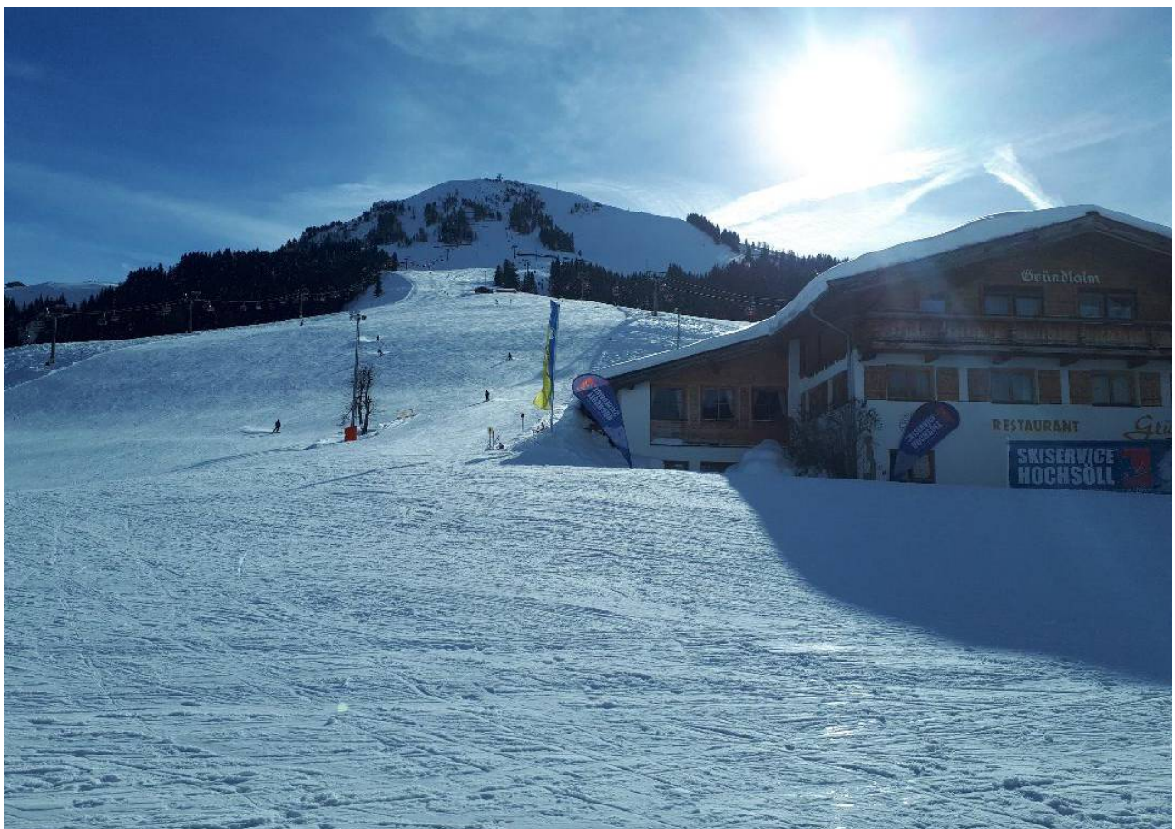
Traumwetter am Freitag Nachmittag